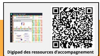
Digipad des ressources d'accompagnement