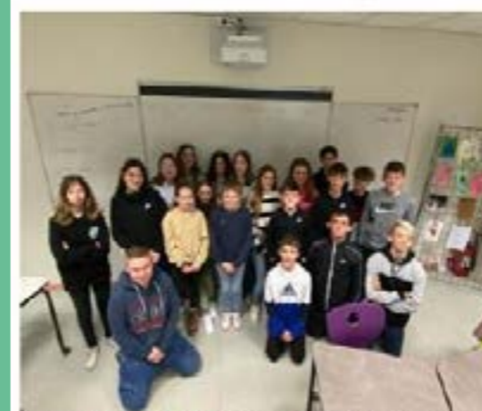
Au collège François-Villon de Walincourt-Selvigny, la classe de quatrième Mandela a débattu au sujet du port de l'uniforme scolaire.